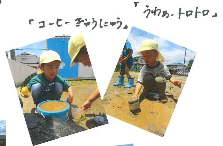
「ユ-ヒ- ちゅうしにやう」 「うわあ. トトロ」