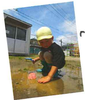
「なんか あったかい」