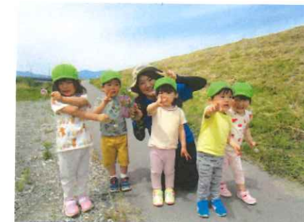
「みんなで ハイ!ポーズ!」