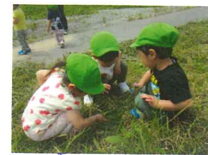
< お友達といっしょ♡ >