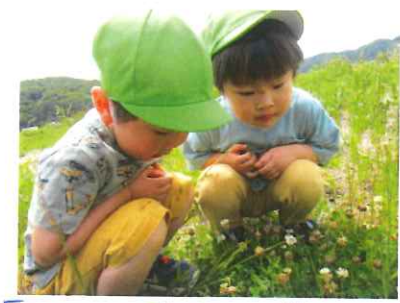
「あした、でてあいでー」