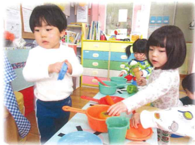
りょうりは おまかせ♡