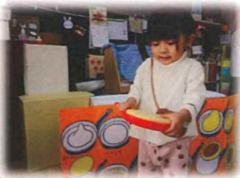
ホットケーキ ひっくり返すよ!