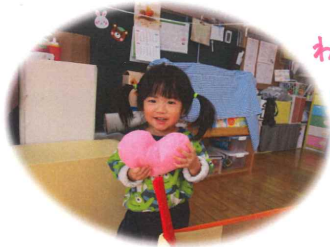
わたしの 愛情 うけとてん♡