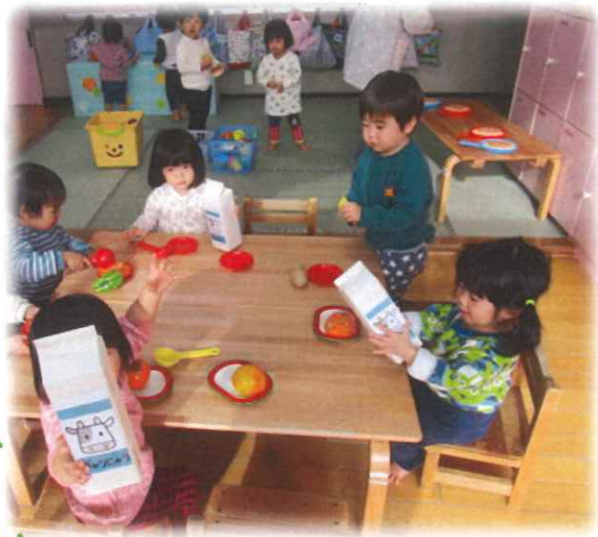
さあ みんなで たべましょ～