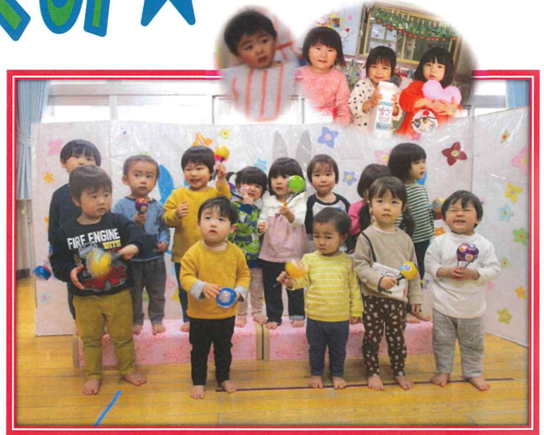
たくさんあそんで、たくさんわらった すみれ組さん！おともだち だいしゆき～♡