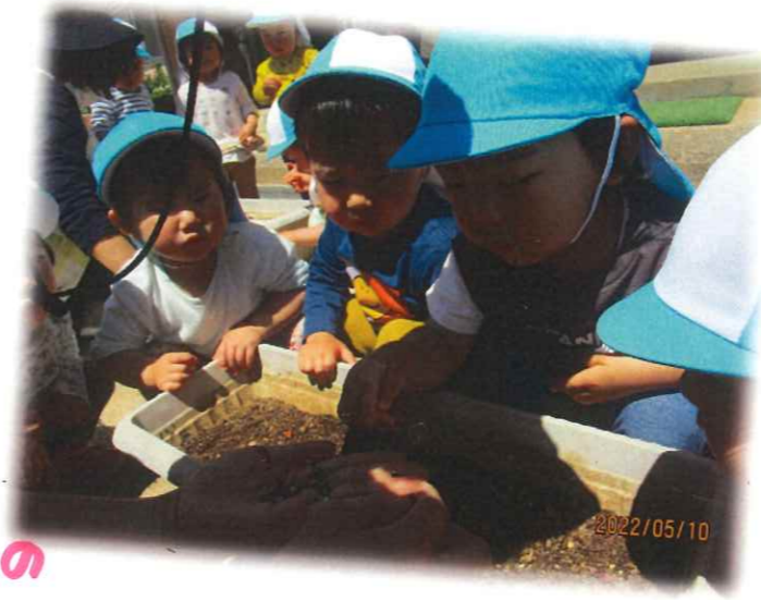
こちらは「フウセンカズラ」のタネを1人ひとつぶまきました♡