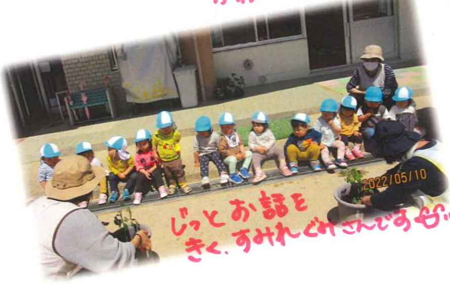
じっとお話を きくあまじいごさんです♡