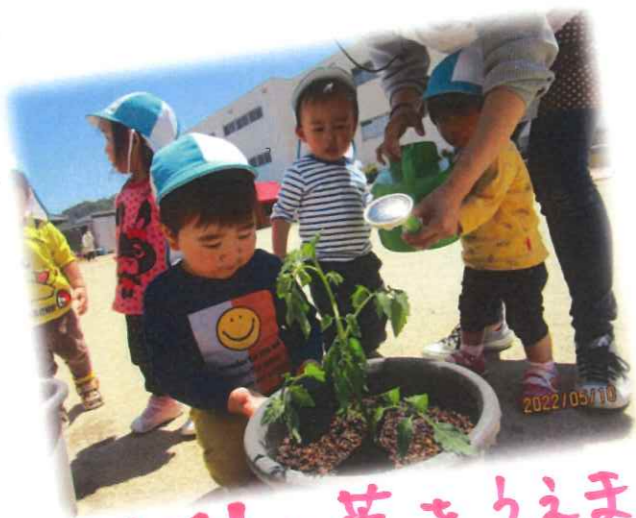
トマトの苗をうえました♪