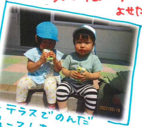
テラスでのんだ ジュース!おいしい〜