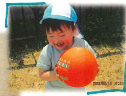
ボール あそびも たのしい♡