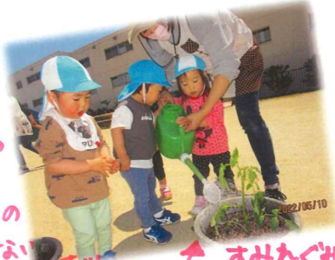
すみれぐみさんのおしごと「水やり」です♡