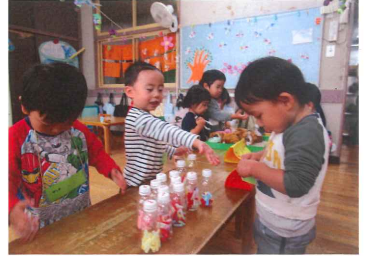
「いちごジュースくびさい」 「10円でーあ」