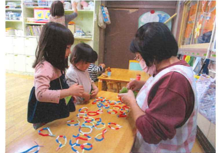
わたしにはあうアスレットほどゆかば...?