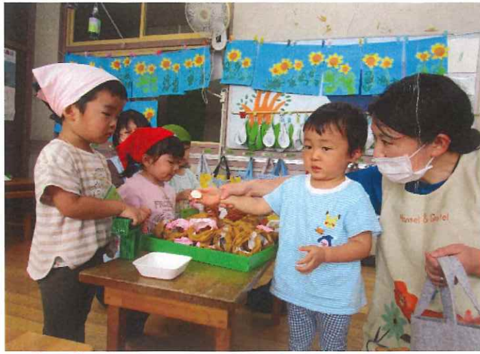
すみれくみさんのおともだちが ドーナツを買いにきてくれました