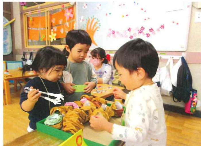
「このドーナツ 2つで100円.おいしいよ!」